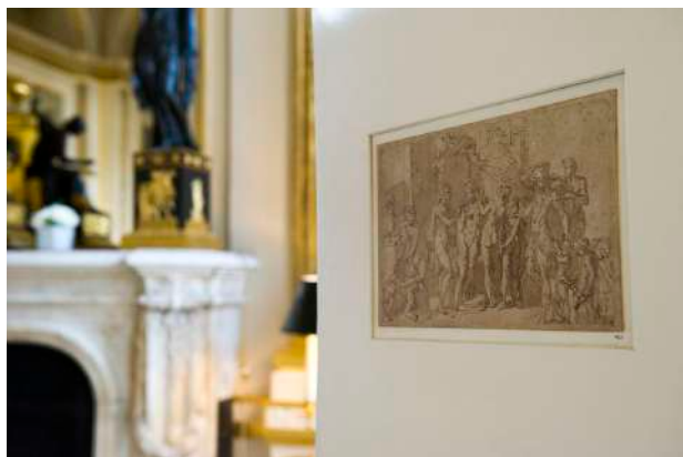
Dessin du Parmesan, restitué en mars 2017

Le 13 mars 2017, une esquisse du peintre vénitien Le Parmesan était restituée par la ministre de la Culture aux héritiers de son propriétaire juif Jules Strauss. Ceux-ci sont ainsi rentrés en possession de l'œuvre confisquée par les nazis lors de la Seconde guerre mondiale. Cette restitution a également remis en lumière la problématique de la restitution des biens spoliés en France par l'Allemagne nazie ou le régime de Vichy.