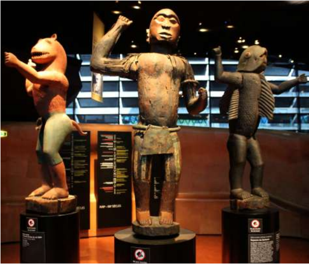
3 grandes statues royales bocio du Royaume du Danhomè: mi-homme mi-requin du roi Béhanzin (1890-92); mi-homme mi-oiseau du roi Ghézo, (XIXe siècle); mi-homme mi-lion du roi Glèlè, (1858-1889), conservées au Musée du quai Branly

Il ne s'agit pas uniquement des œuvres les plus emblématiques, que faire des fonds dormants ?