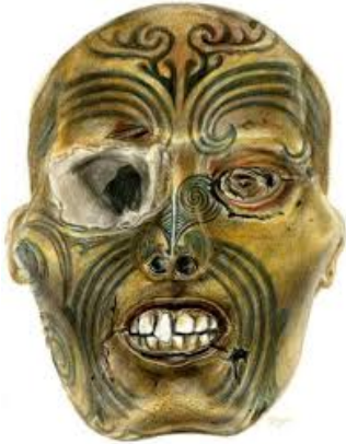
Tête maori restituée à la Nouvelle-Zélande

Le 18 mai 2010, le Parlement français a le dernier mot. Il déclare : « Les têtes maories conservées par des musées de France cessent de faire partie de leurs collections, pour être remises à la Nouvelle-Zélande ».