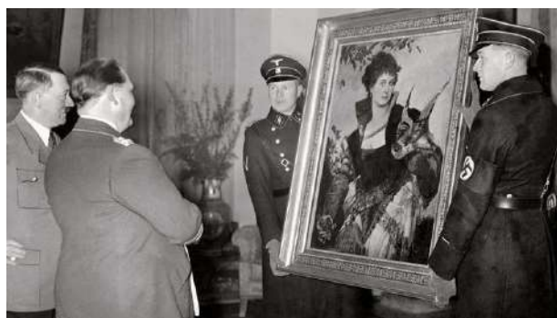
Photographie du ministre Hermann Goering offrant un tableau au chancelier Hitler

Les œuvres ainsi dérobées sont éparpillées : certaines d'entre elles sont destinées à l'immense Führersmuseum qu'Hitler souhaite construire à Linz, d'autres sont récupérées par de hauts dignitaires du Reich.