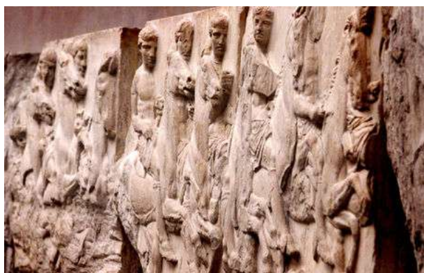
Frises du Parthénon ou "marbres d'Elgin" apportées à Londres en 1801, réclamées par la Grèce depuis 1982

Restituer certaines œuvres aux pays d'origine n'empêche pas pour autant la circulation des œuvres dans le monde, elle peut être réduite cependant en fonction des politiques culturelles.