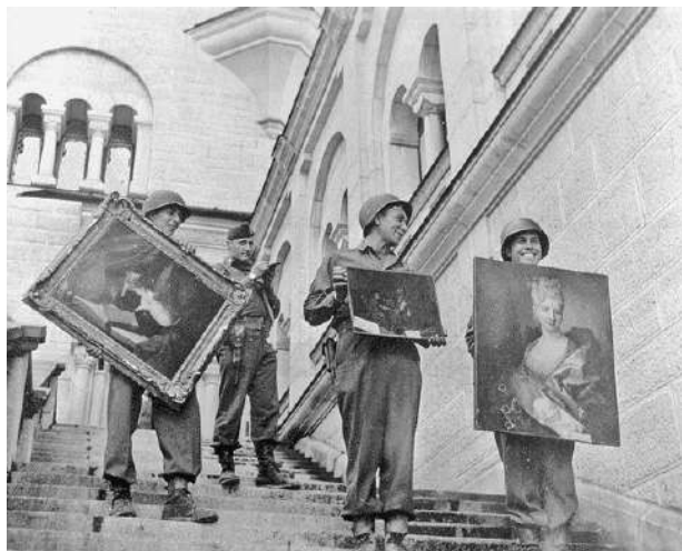
Photographie montrant des tableaux retrouvés par les Monument men au château de Neuschwanstein

prescription. Le corps des 350 Monument Men a permis le retour en France d'une partie des œuvres déplacées ailleurs en Europe.